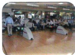
ボウリングクラブ