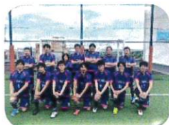
フットサルクラブ