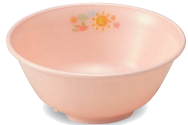
新 PNB-526E NIJP 幼児椀 120×51・295ml ¥1,380