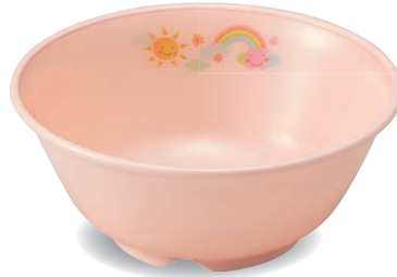
新 PNB-528E NIJP 椀 127×53・365ml ¥1,460