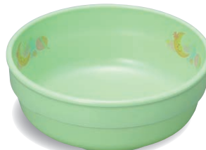
新 PNS-312E NIJG 深皿 105×40・230ml ¥1,260