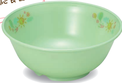
新 PNB-530E NIJG 椀 135×55・435ml ¥1,520