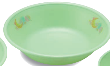
新 PNS-13E NIJG 深皿 130×32・210ml ¥1,370