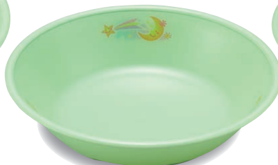
新 PNS-14E NIJG 深皿 145×33・310ml ¥1,550