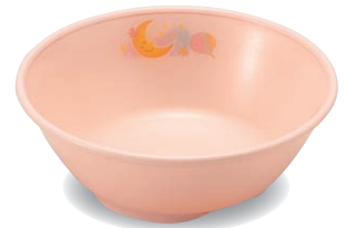
新 PNS-12E NIJP 深皿 106×37・180ml ¥1,180