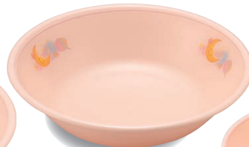
新 PNS-13E NIJP 深皿 130×32・210ml ¥1,370