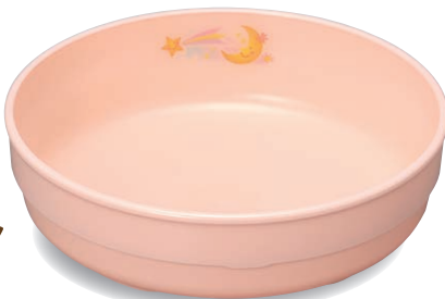
新 PNS-314E NIJP 深皿 142×40・460ml ¥1,770