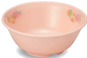
新 PNB-524E NIJP 幼児椀 117×47・260ml ¥1,280