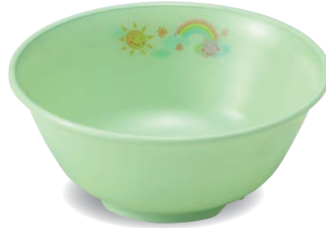
新 PNB-528E NIJG 椀 127×53・365ml ¥1,460