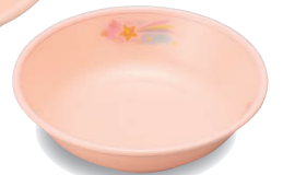
新 PNS-11E NIJP 深小皿 99×26・110ml ¥1,140