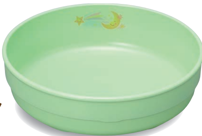
新 PNS-314E NIJG 深皿 142×40・460ml ¥1,770