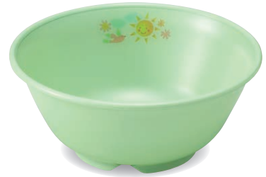
新 PNB-526E NIJG 幼児椀 120×51・295ml ¥1,380