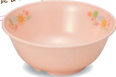
新 PNB-530E NIJP 椀 135×55・435ml ¥1,520