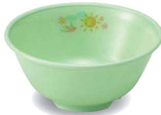
新 PNB-522E NIJG 乳児椀 107×47・220ml ¥1,200