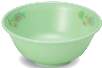
新 PNB-524E NIJG 幼児椀 117×47・260ml ¥1,280