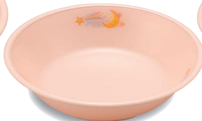
新 PNS-14E NIJP 深皿 145×33・310ml ¥1,550