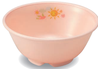
新 PNB-522E NIJP 乳児椀 107×47・220ml ¥1,200