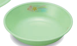
新 PNS-11E NIJG 深小皿 99×26・110ml ¥1,140