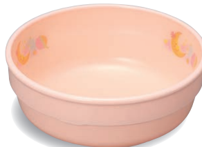
新 PNS-312E NIJP 深皿 105×40・230ml ¥1,260