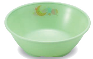
新 PNS-12E NIJG 深皿 106×37・180ml ¥1,180